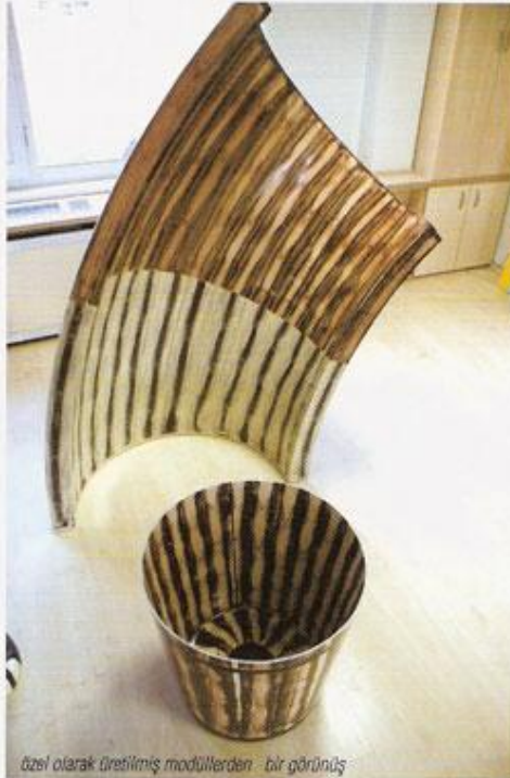
özel olarak üretilmiş modüllerden bir görünüş