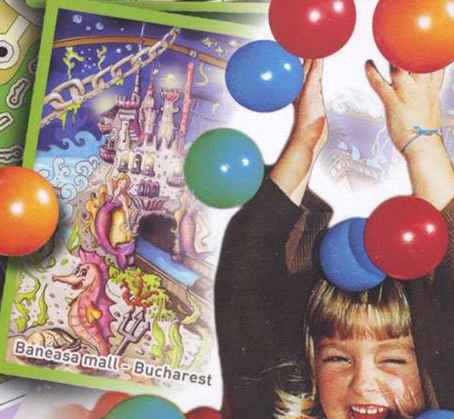
Baneasa Mall - Bucharest