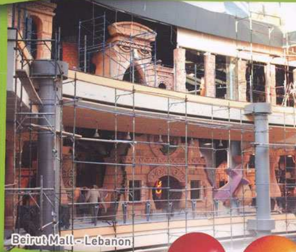
Beirut Mall - Lebanon