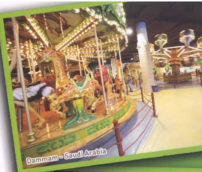
Dammam - Saudi Arabia