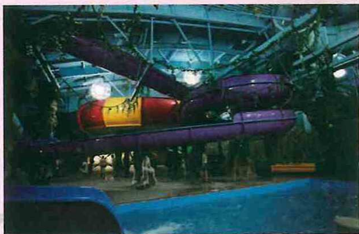
▲ 波林 Polin- 室内水乐园项目一角

波林水上乐园和水池系统公司1976年成立，位于土耳其伊斯坦布尔，已经成为全球领先的水上乐园企业。在水上乐园、水上滑道和水上游乐设备的设计、制造和安装方面，波林在全球市场上都是佼佼者。